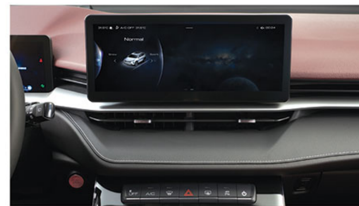
■ سیستم مولتی مدیا لمسی ۱۲،۳ اینچی