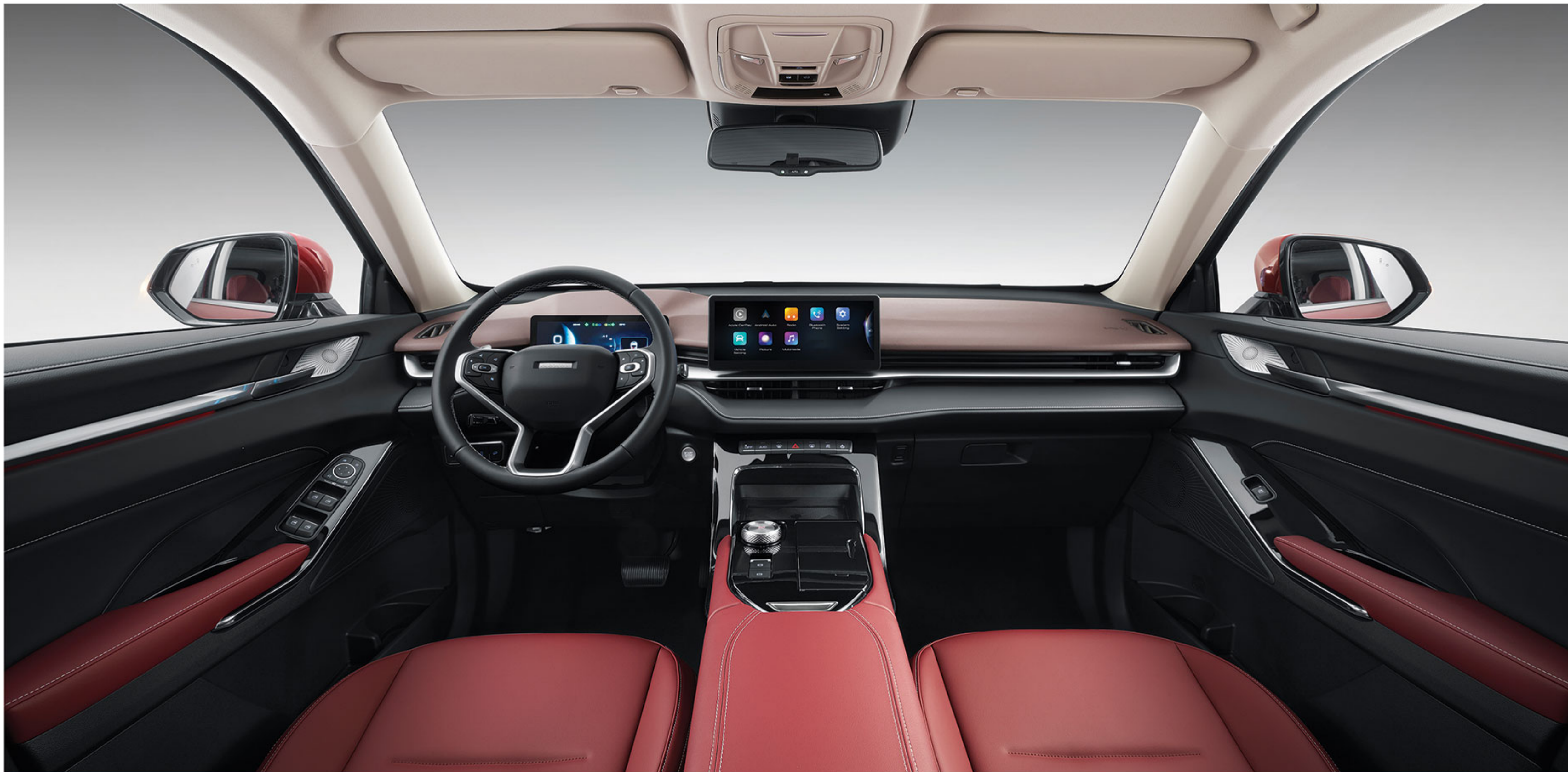
کابین لوکس و بزرگ