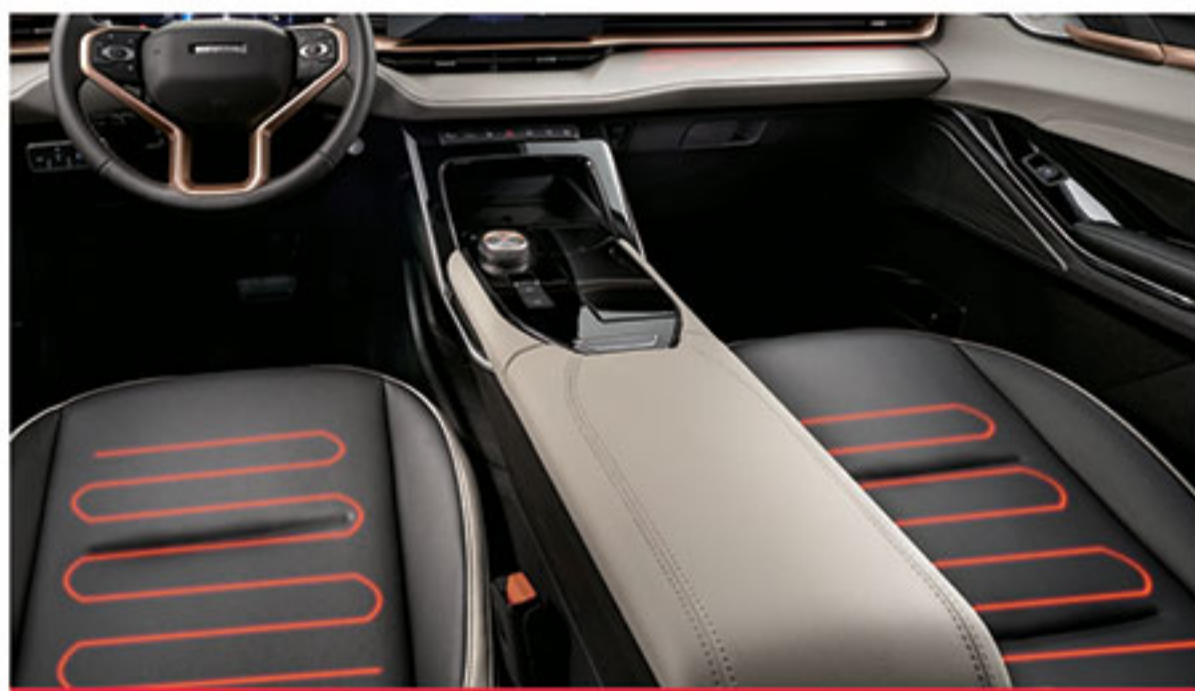
■ گرم کن صندلی راننده و سرنشین جلو