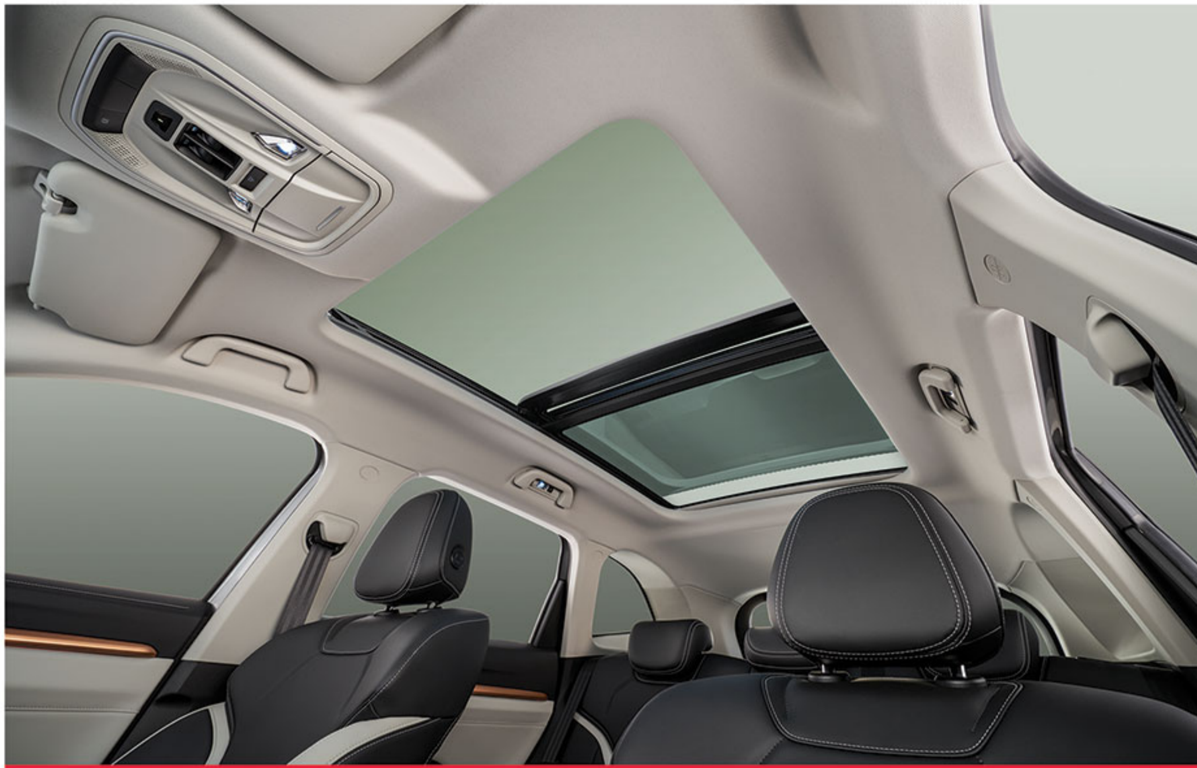
■ سانروف پانوراما