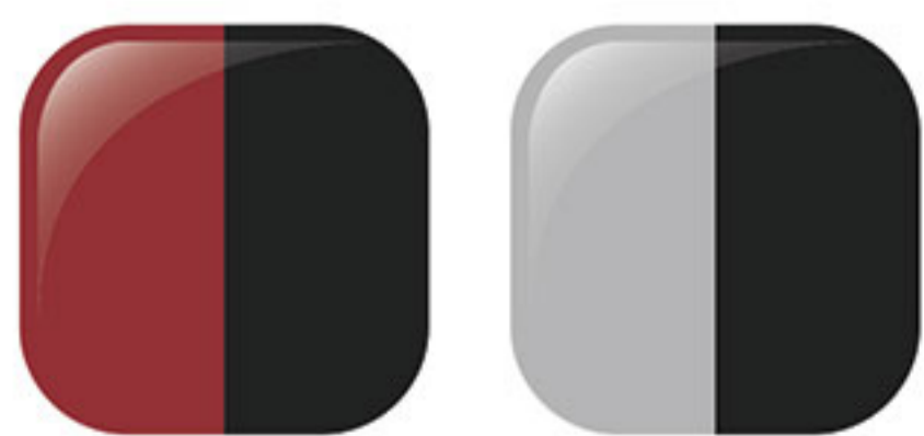
مشکی / قرمز