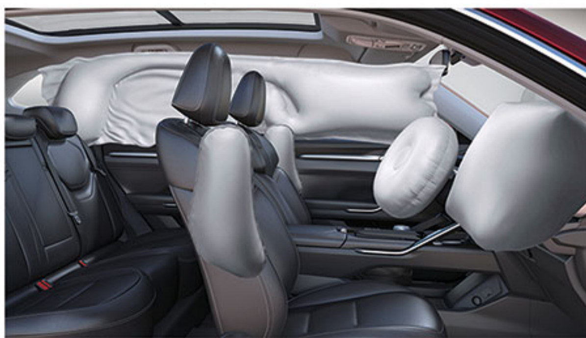
■ کیسه هوای راننده و سرنشین جلو، جانبی و پرده ای