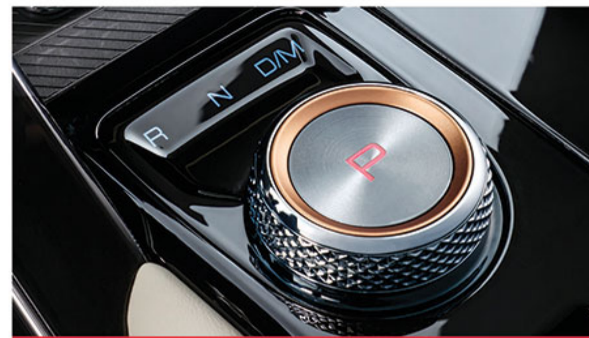
■ تعویض دنده الکترونیکی