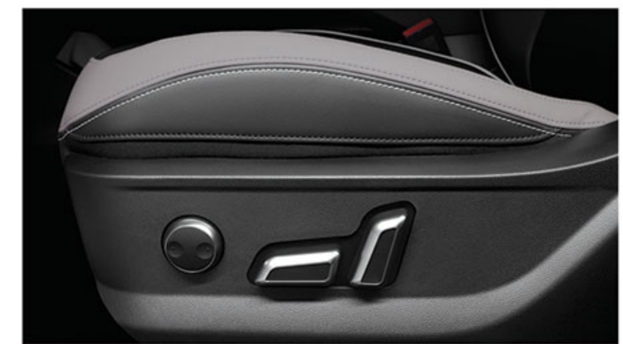
■ تنظیم برقی صندلی راننده و سرنشین جلو