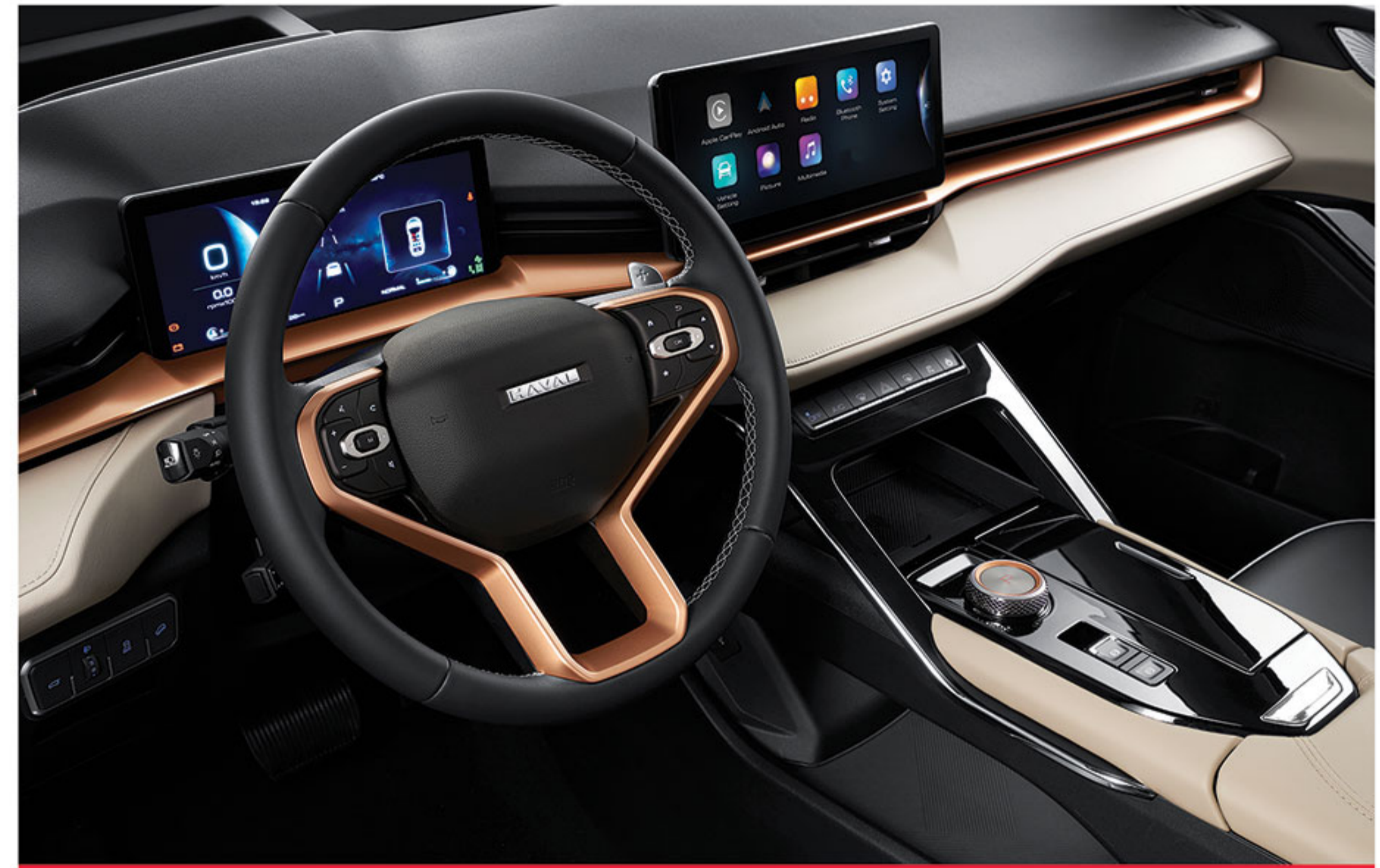
■ فرمان چرمی مجهز به کلید های دسترسی به سیستم مولتی مدیا