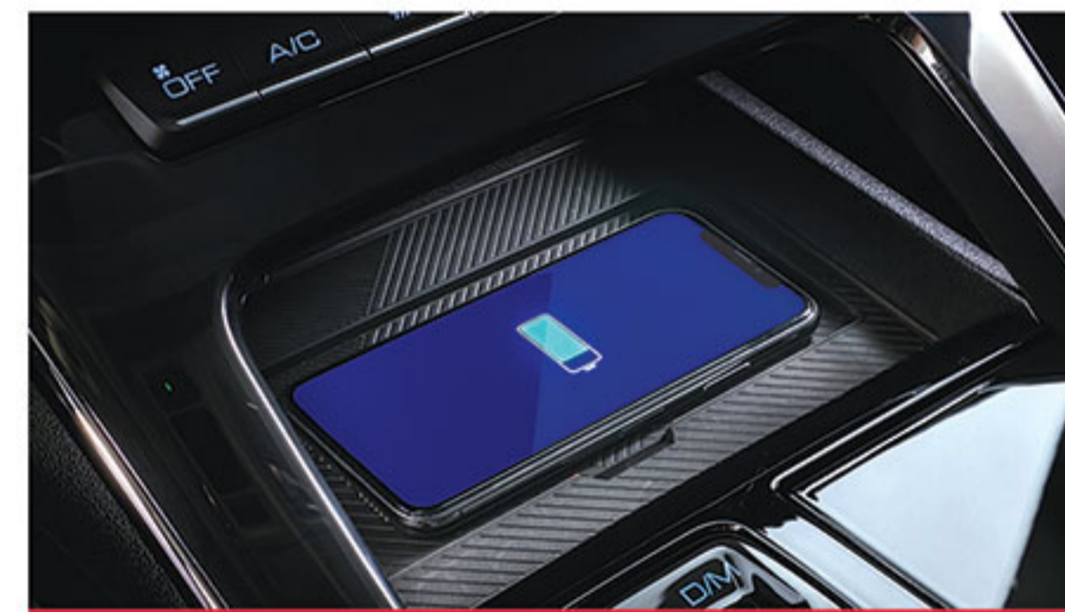
■ شارژر وایرلس