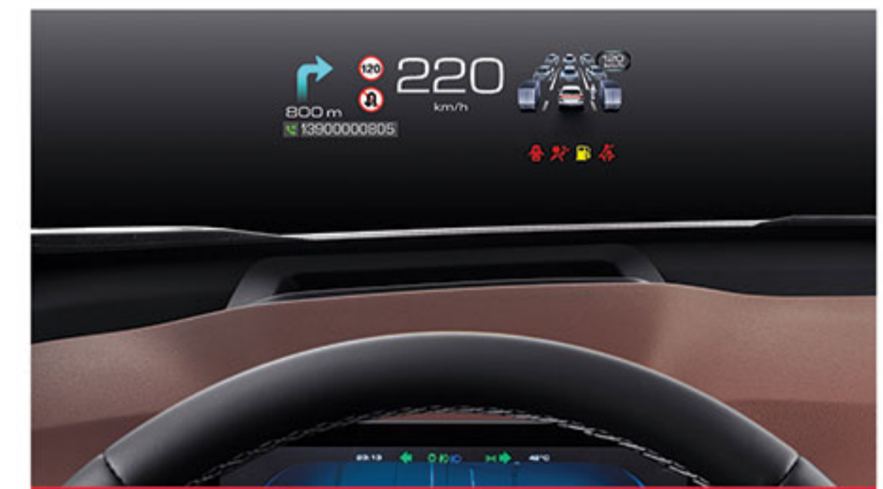
■ نمایش اطلاعات رانندگی بر روی شیشه جلو (HUD)